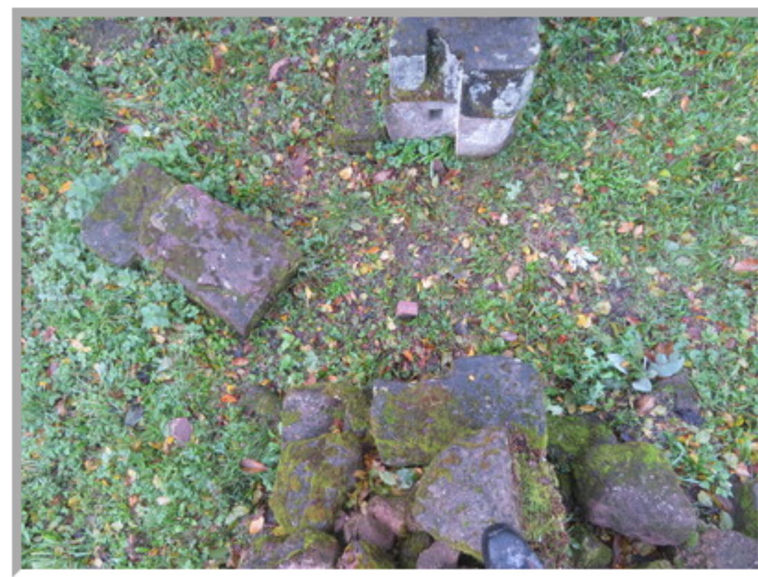
Vue de dessus du montant de porte (sous la chaussure)... et, dans l'herbe, la partie qui va pile dessus en la tournant de 150 ° sens des aiguilles d'une montre.