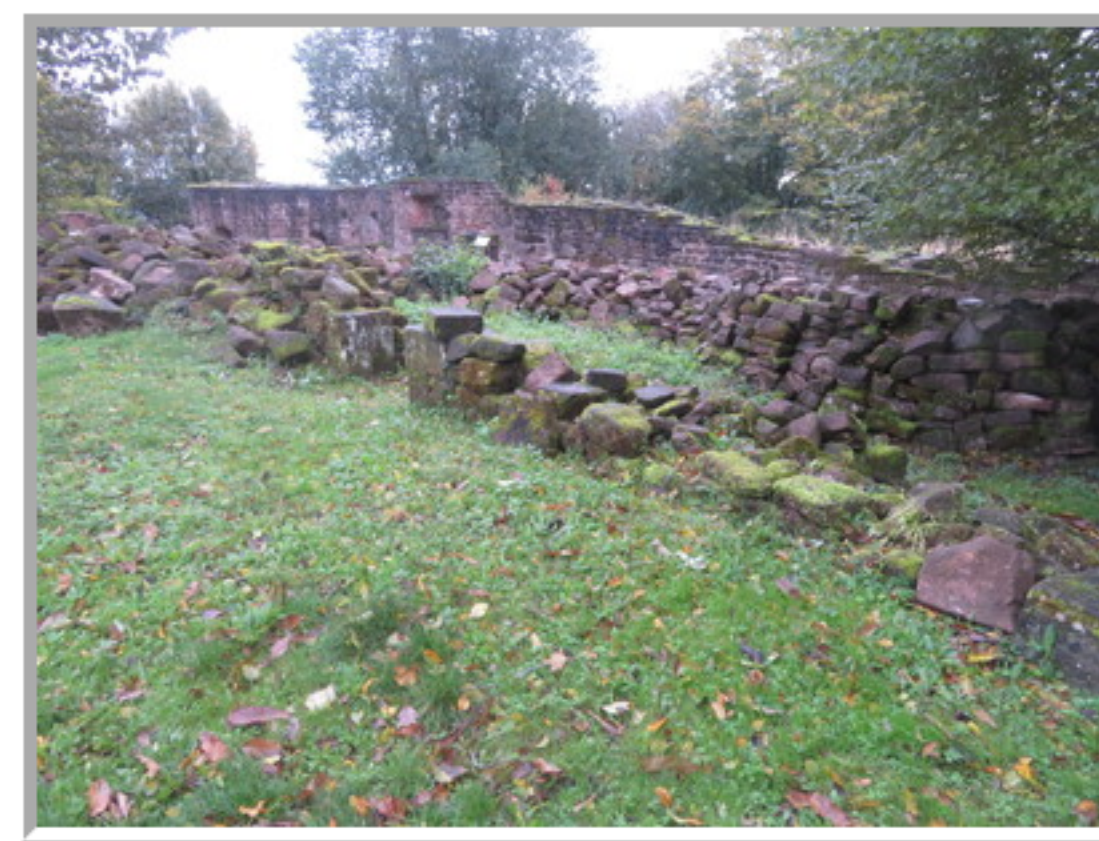
Le mur et la porte "Avignon" vus depuis la cabane