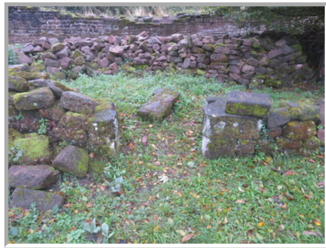
La pierre par terre est en fait une partie du montant de porte.