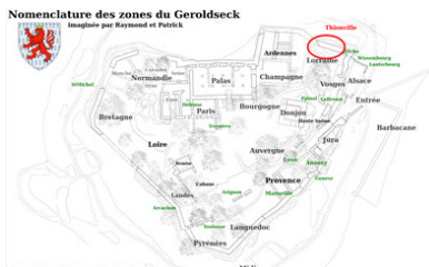
Plan de Jean-Michel Rodrauf et Klaus Trompke

Dans le coin Nord-Est de la courtine, derrière l'éperon Bitche ont été élevés deux murs perpendiculaires avec des blocs à bossage provenant certainement du donjon.