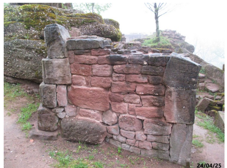
Face Sud, à jointoyer.