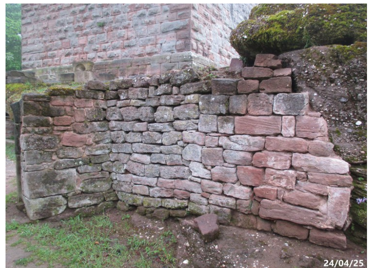
La consolidation du mur Est a été réalisée en 2020