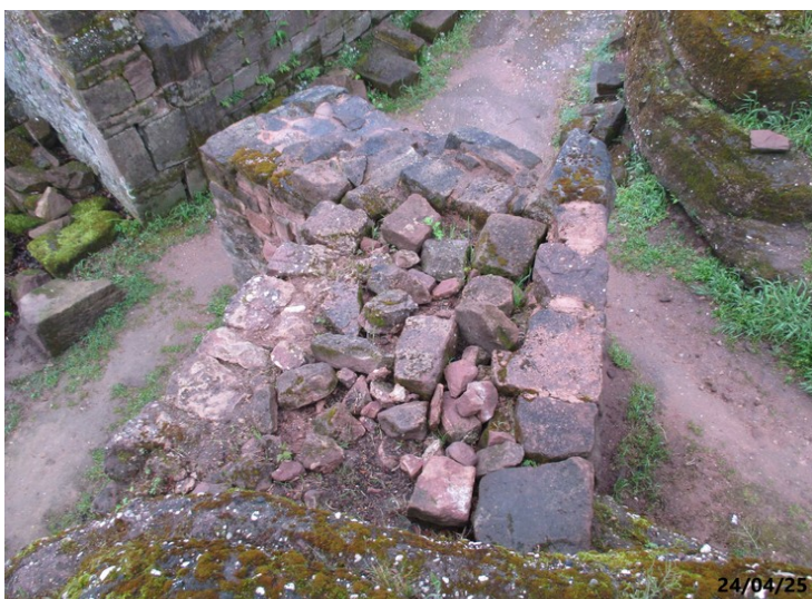
Le rocaillage du dessus doit être revu.