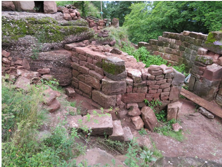
Vue sur la zone en 2021. Face Ouest et Sud