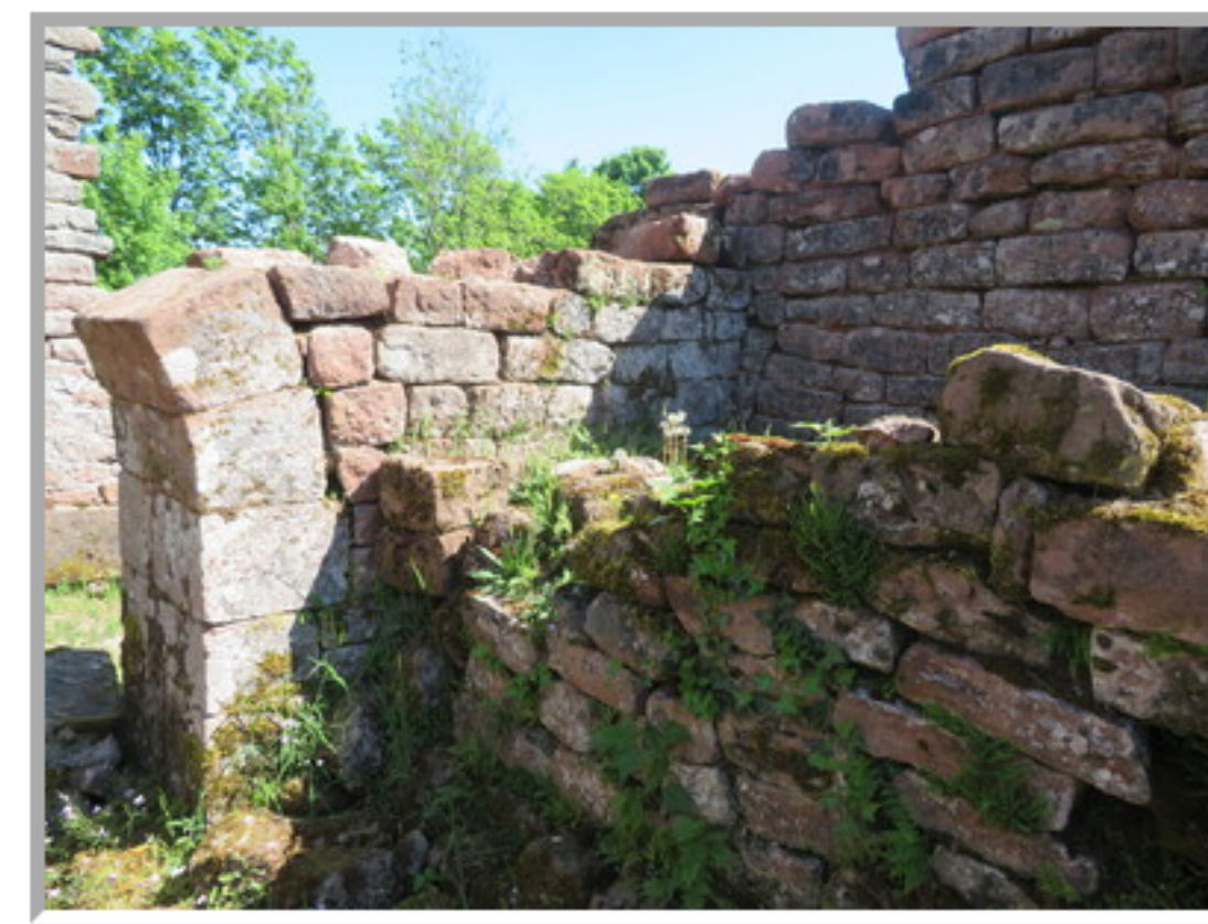
ça penche dangereusement