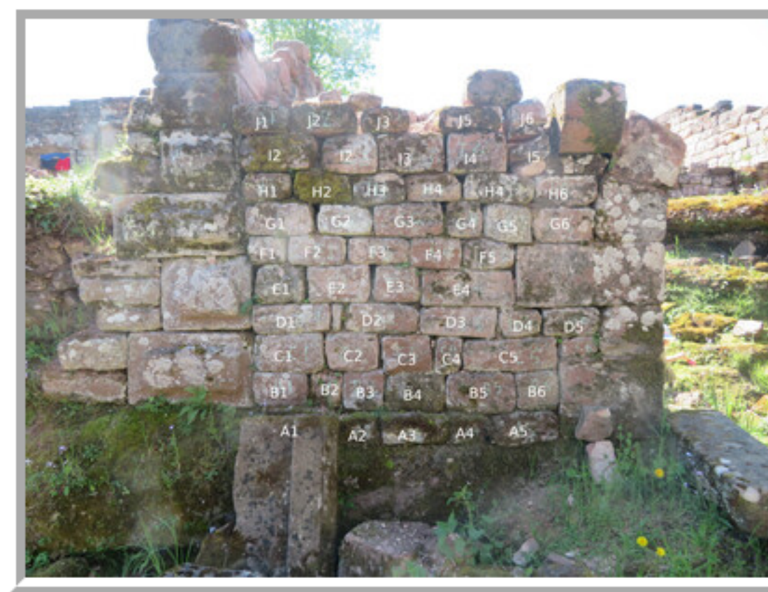
Les pierres numérotées